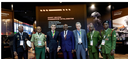
Delegação de Angola