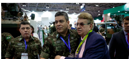
Diretor de Fabricação do DCT do Exército, gen. Tales Villela