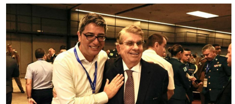
Senador Carlos Portinho