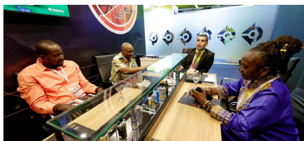
Delegação de Gana