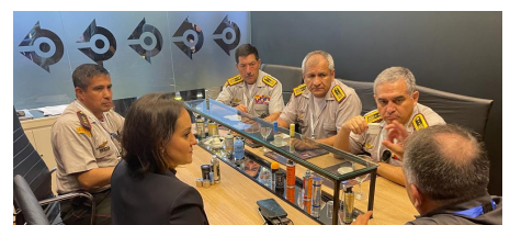
Delegação do Equador