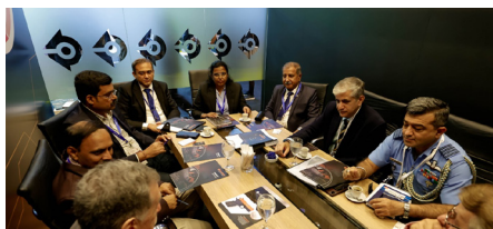
Delegação da Índia