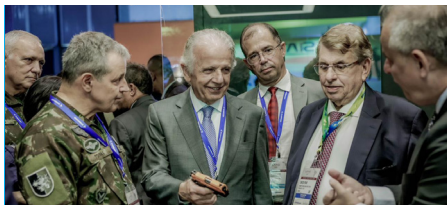
Ministro de Estado da Defesa, José Múcio